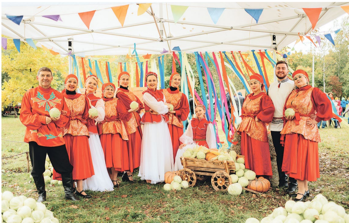
«Купчинский кочан» – это большой фестиваль, где выступали артисты, работали кузница, парк деревянных игр, лекторий, собственный мини-зоопарк и не только