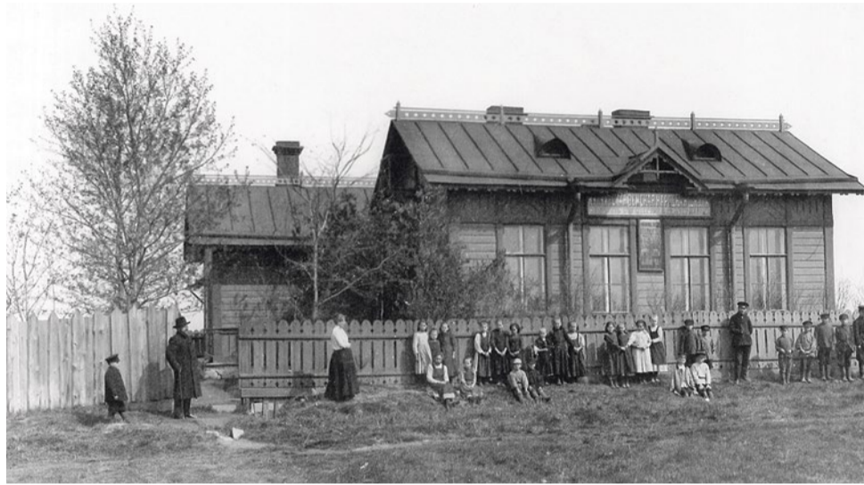
Купчинская земская народная школа в память события 19 февраля 1861 года.

4) Школа должна быть построена в части Санкт-Петербургского уезда, населенной исключительно крестьянами русского происхождения.