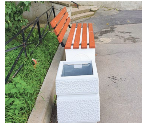
Новая урна на Софийской, 41/1