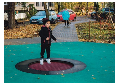
Батуты вмонтированы в покрытие площадки