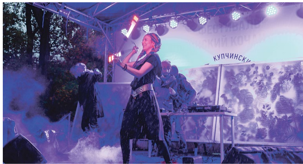
Капустный рейв на злаковом поле