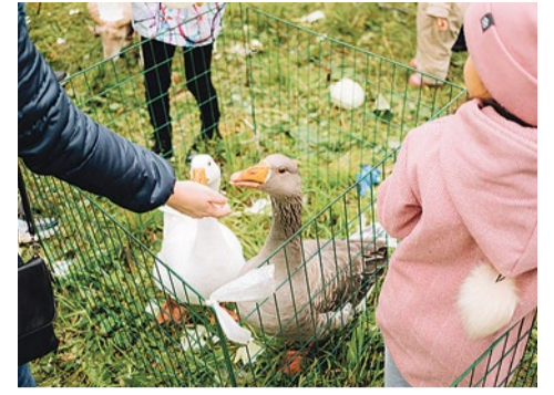
Два веселых гуся – один серый, другой белый