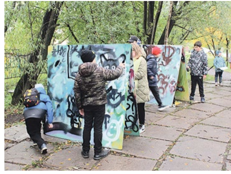
В сквере «Кольцо» учили рисовать баллончиками

А еще в сквере учились плести узелки на счастье, обменивались вещами и украшали себя блестками.