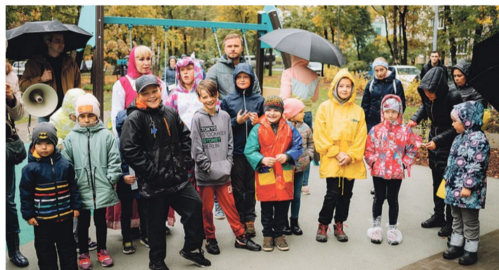
Юных жителей на открытии площадки развлекали аниматоры

Еще одно новшество площадки – первый в Петербурге уличный стере-