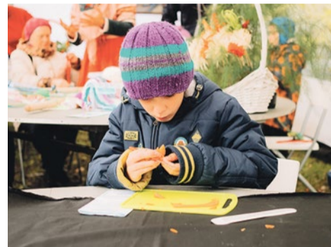
В палатке мастер-классов весь день было многолюдно

Злаковое поле на время превратилось в большую, веселую деревню. Стены палатки с мастер-классами украшены интересными картинками купчинских художников, а розы за столом для «резьбы по овощам» были сделаны из лепестков капусты. В палатке мастер-классов весь день было многолюдно: одни уносили