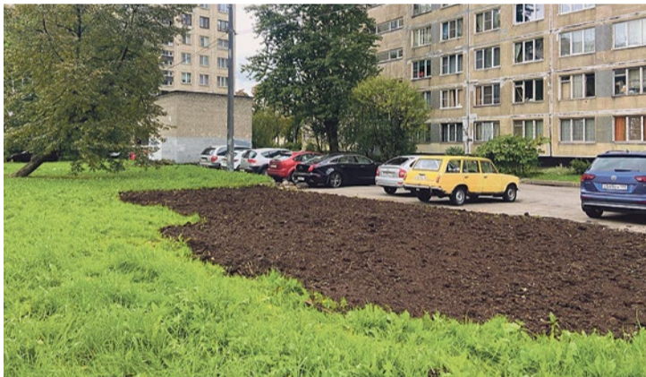
Восстановление газона на проспекте Славы, 60