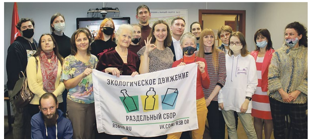
Зеленым активистом может стать каждый

30 сентября жители посетили лекцию с говорящим названием «Легко ли быть зеленым активистом?». На ней обсуждали трудные задачи и плодотворные результаты, которые появляются у человека, когда он начинает заботиться об экологии. Также лекторы познакомили участников с возможностями для реализации себя в экологических активностях и проектах.