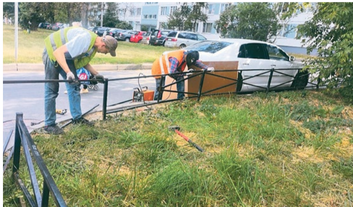
Ремонт ограждений на Софийской, 41/1