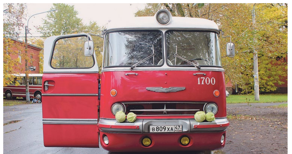
Икарус-55 «Люкс».