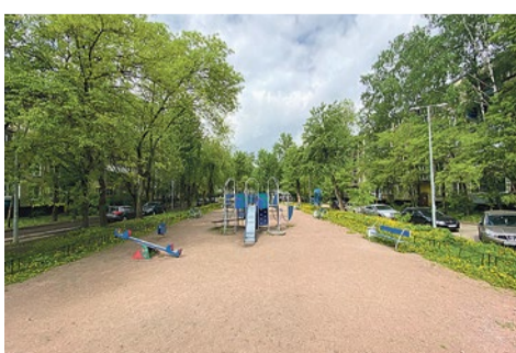
Дворовая территория на Софийской до реконструкции