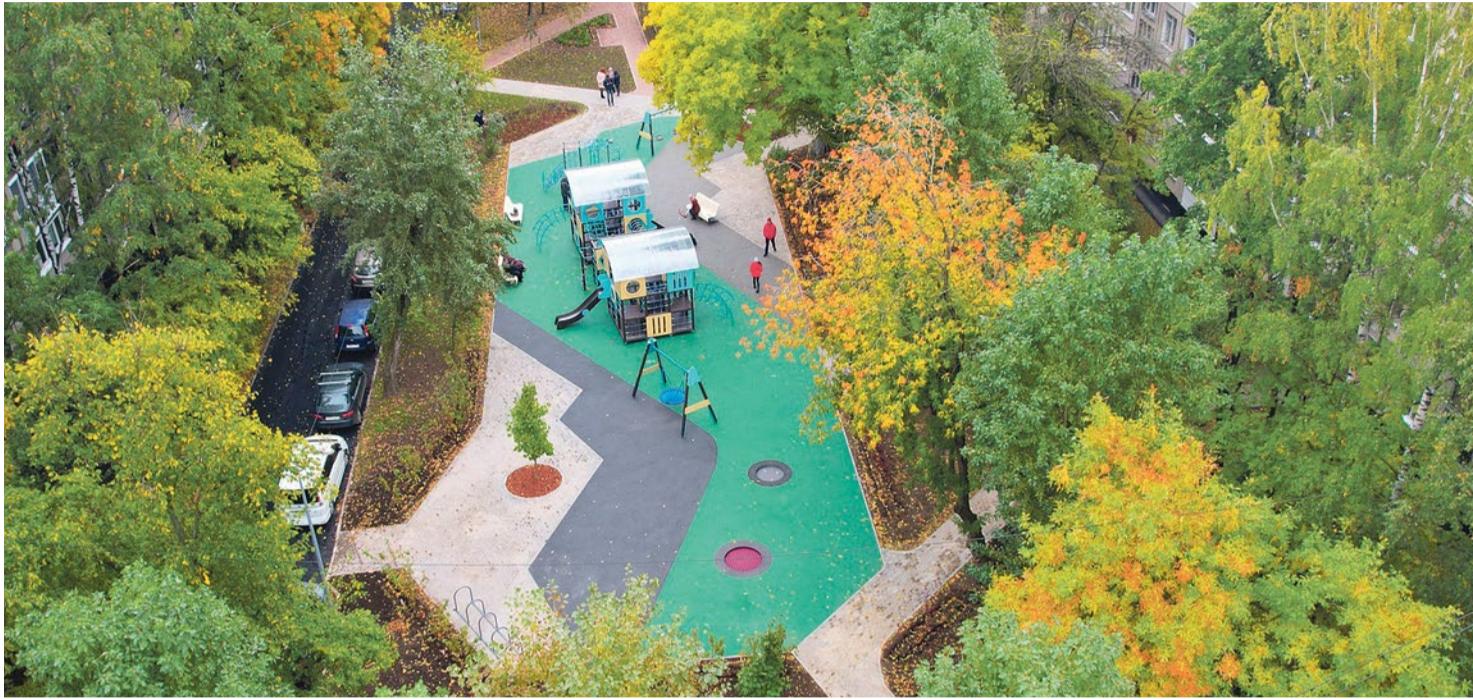
Вид сверху на новую площадку на Софийской, 20/3

Шумно, весело и празднично во дворе дома 20/3 на Софийской улице отметили открытие новой детской площадки. Событие по-настоящему знаковое – это первый большой проект нынешней команды муниципалитета № 72. При проектировании площадки они старались учесть все пожелания жителей: не только взрослых, но и самых главных пользователей игрового комплекса – подростков.