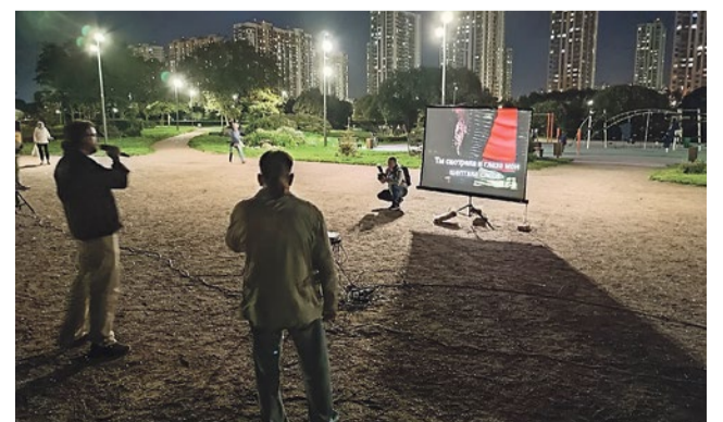
Участвовать в караоке очень просто – нужно глубоко вдохнуть, быстро подойти к ведущему и заказать «минусовку» любимой песни