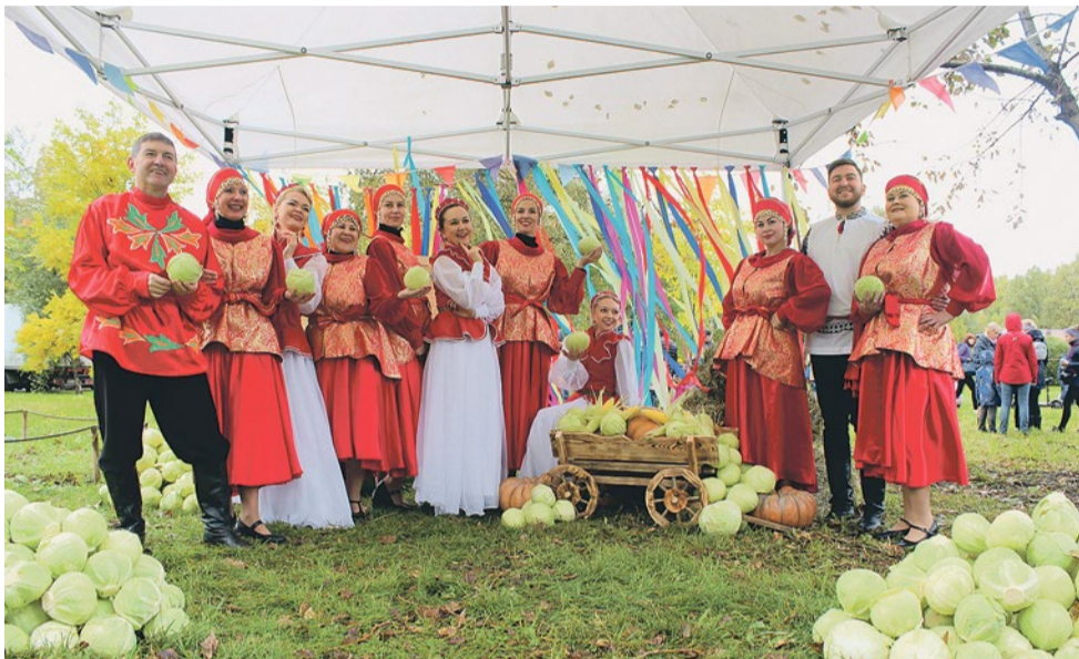
Злаковое поле на время превратилось в большую веселую деревню

Капустные гулянья, выставка ретроавтобусов, чеканка монет и капустный рейв – в окрестностях Фарфоровского поста прошел первый в истории района фестиваль «Купчинский кочан – 2021». Издревле на территории Купчина выращивали капусту, а затем с размахом отмечали окончание сбора урожая. Новый праздник – это возрождение старых традиций. «Муниципальное обозрение» подробно рассказывает, чем запомнился необычный фестиваль.