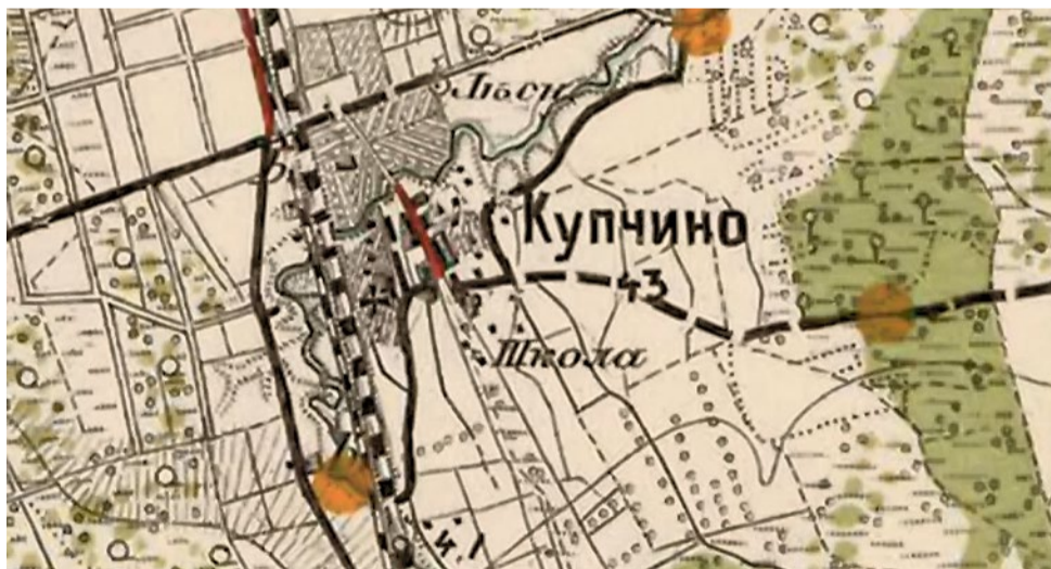
Фрагмент карты окрестностей Санкт-Петербурга, 1909 год

Какого-либо интереса к судьбе купчинской школы со стороны Комитета грамотности впоследствии замечено не было, если не считать посещения школы членами совета Комитета весной 1893 года и награждения ее учеников изданиями Комитета летом 1894 года. Сама же школа простояла вплоть до начала блокады Ленинграда, а ее учителя многие годы «сеяли знания на ниву народную», сообразуясь, разумеется, с веяниями времени.